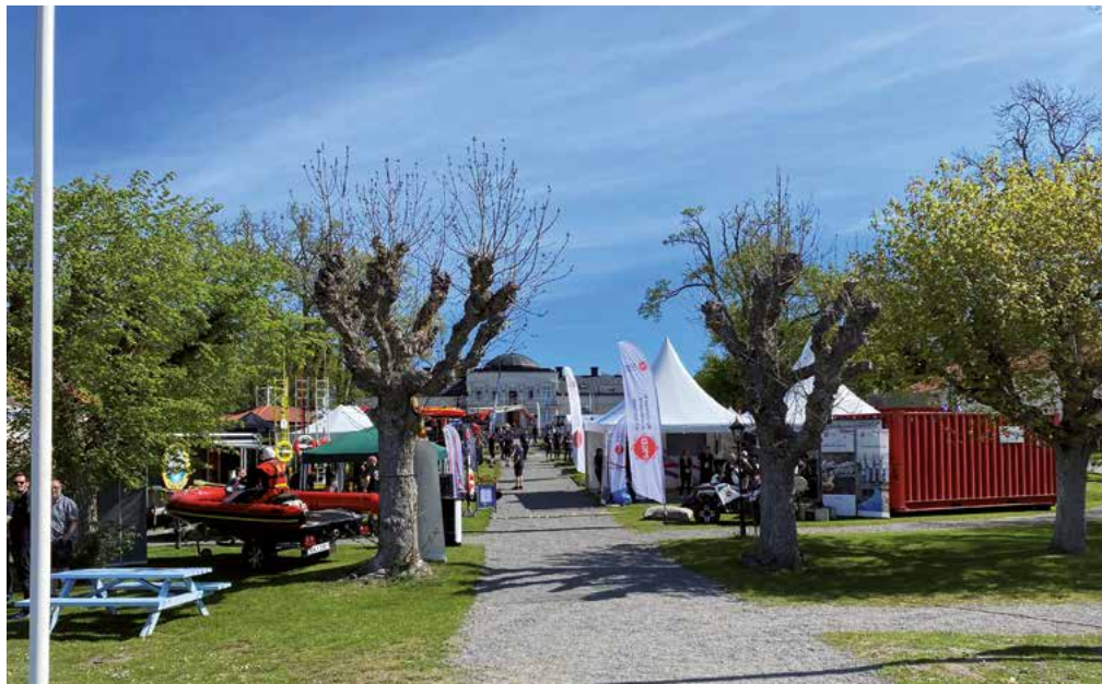
Lugnet före stormen. Årets mässta genomfördes i strålande solsken och lockade omkring 400 besökare.