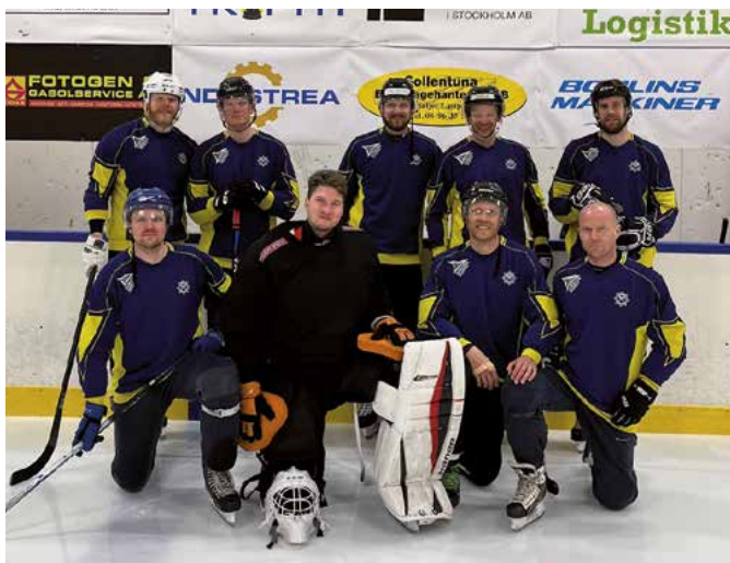
Nerike tog hem silvret...