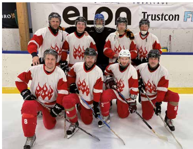
...och Umeå åkte hem med ett brons.