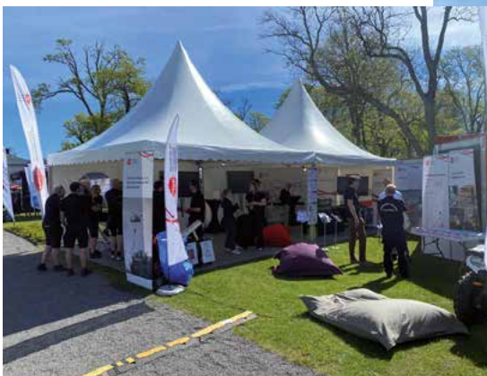
Till vänster: MSB kom med en delegation om tio personer.