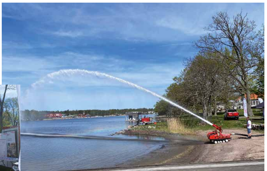
Ovan: Förelisning av robot.