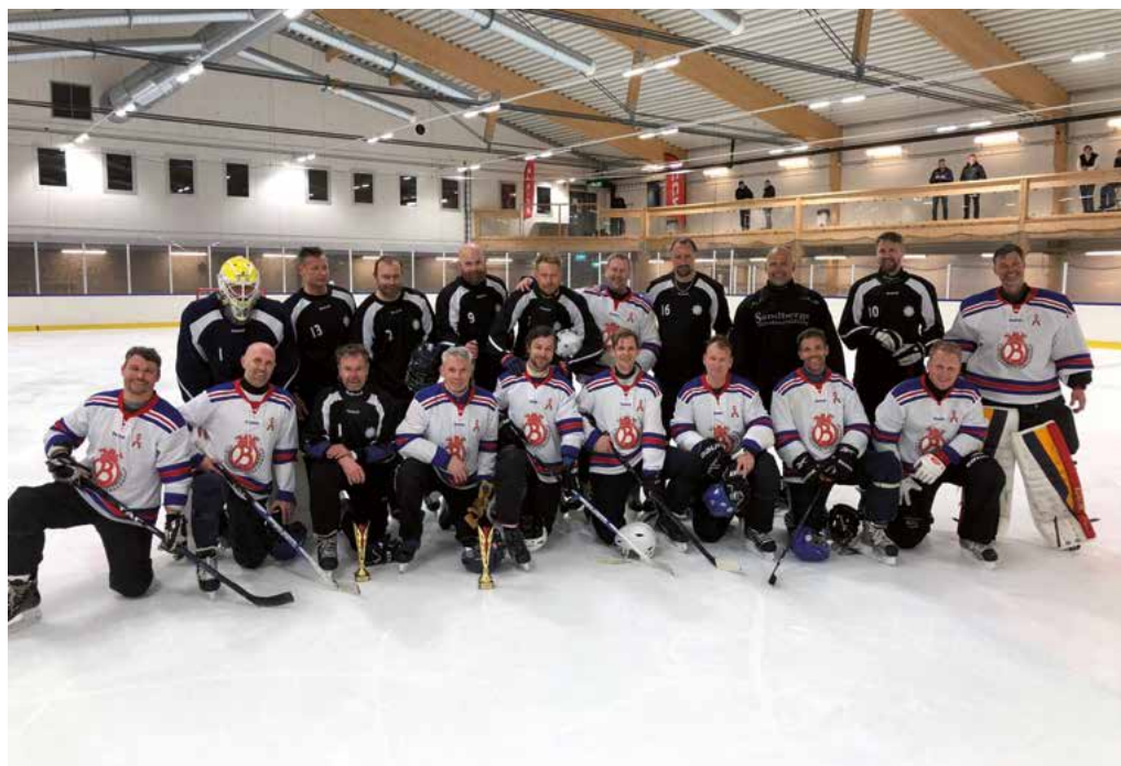
Finallagen i rinkbandyns oldboys. NÄRF i svart och Brännkyrka i vitt.

Brännkyrka 8 poäng NÄRF 3 poäng Stockholm 4 poäng Södertörn 2 poäng Söderhamn 0 poäng