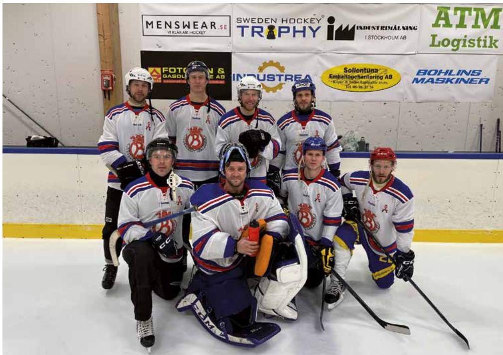
Bäst i rinkbandyns allmänna klass - Storstockholms brandförvar.

Stort grattis till segrande Storstockholm.