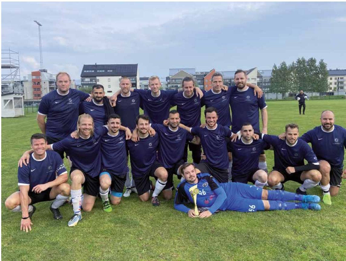
Södertörns 11-mannalag i fotboll kan titulera sig svenska mästare efter tre vinster och en oavgjord match.