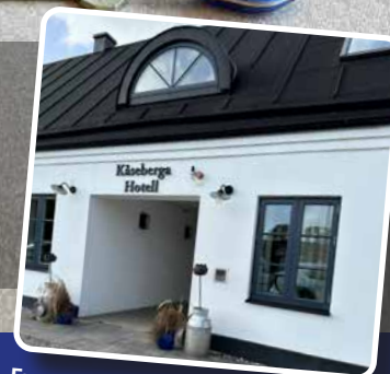
Exempel på montering av nyckel- skåp för automatiska brandlarm.

Vi leverera nyckelskåp med samtliga låssystem som används av Räddningstjänsten. Och som givetvis är i högsta skyddsklass 5.