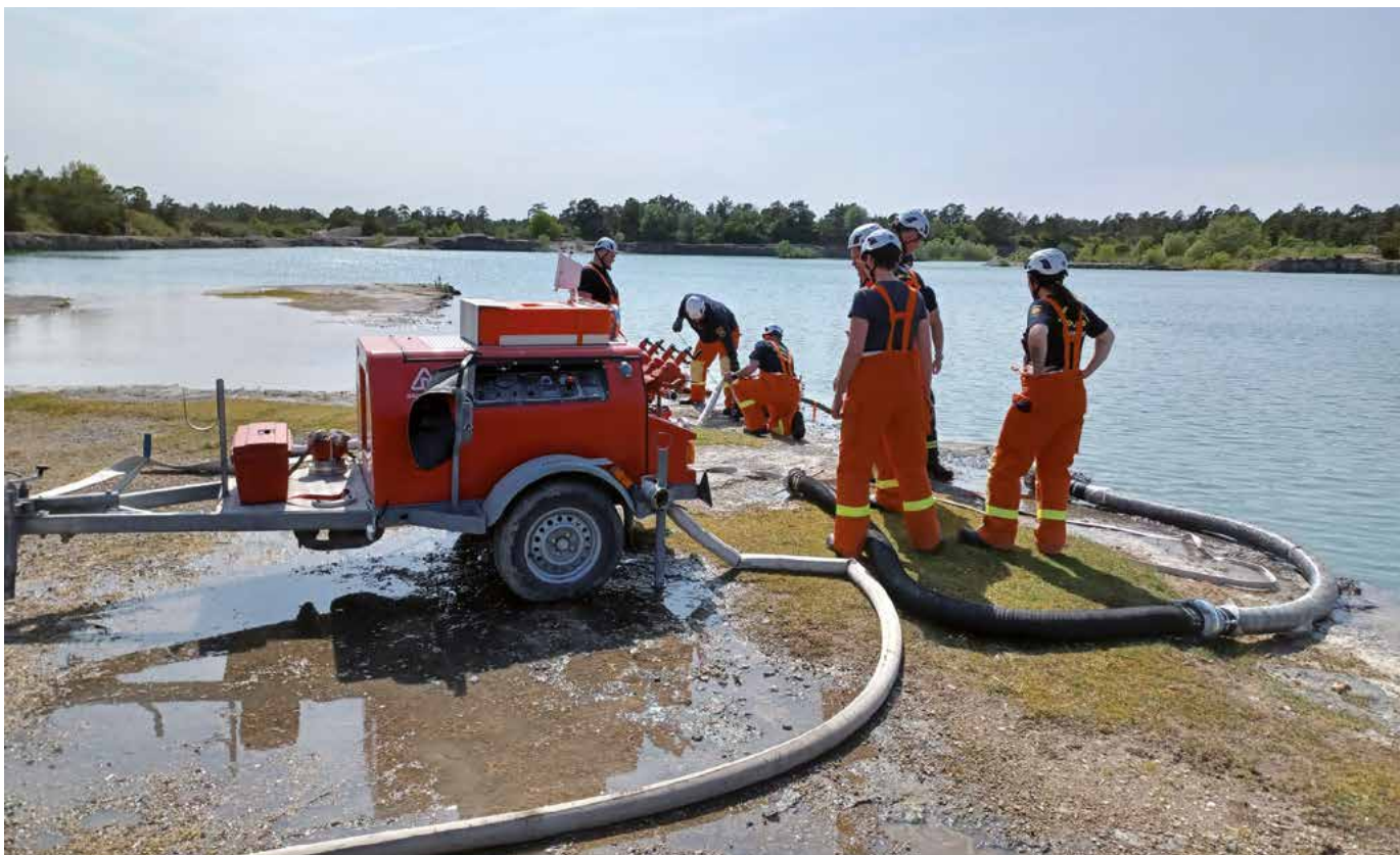
De 31 nya medarbetarna i Gotlands nya förstärkningsgrupp får bland annat en tvådagarsutbildning i mark- och skogsbrand.