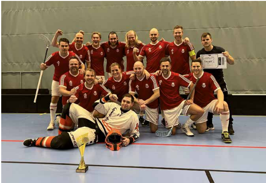
Grattis BIK Storstockholm som kammade hem guldpokalen efter både förlängning och straffar. Nästa år står de som arrangörer av innebandy-SM.