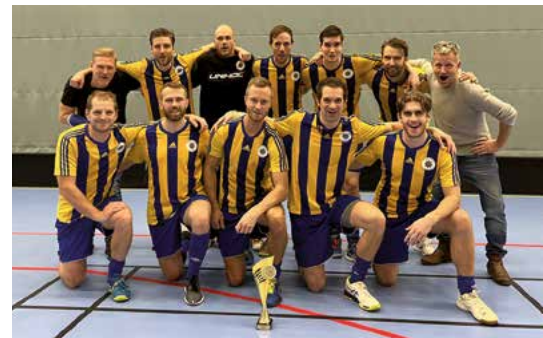
Silvret gick till Jönköping...