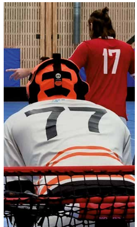
Intensivt spel, "nagelbitarmatcher" och glad avslutningsfest bjöds det på den 10 november när brand-SM i innebandy avgjordes i Sundsvall. 10 lag kämpade om segern och efter 27 matcher gick guld till huvudstaden.