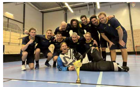
...och bronset till Dala Mitt.